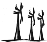
Windpark Pillenbruch GmbH & Co. KG