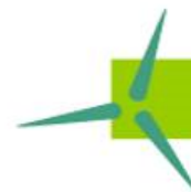
Bürgerwindgemeinschaft Heide- Wind GmbH & Co. KG