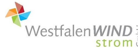
WestfalenWIND Strom GmbH