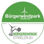
Bürgerenergie Straelen Auwel Wind eG & Co. KG