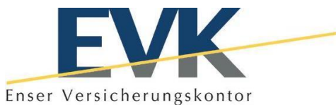
Enser Versicherungskontor GmbH